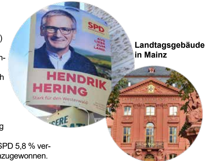
Landtagsgebäude in Mainz