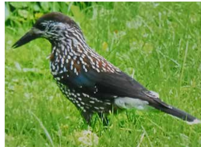
Dickschnäbeliger Tannenhäher. in Hachenburg Barrwiese 8 am 24. Juli 2016