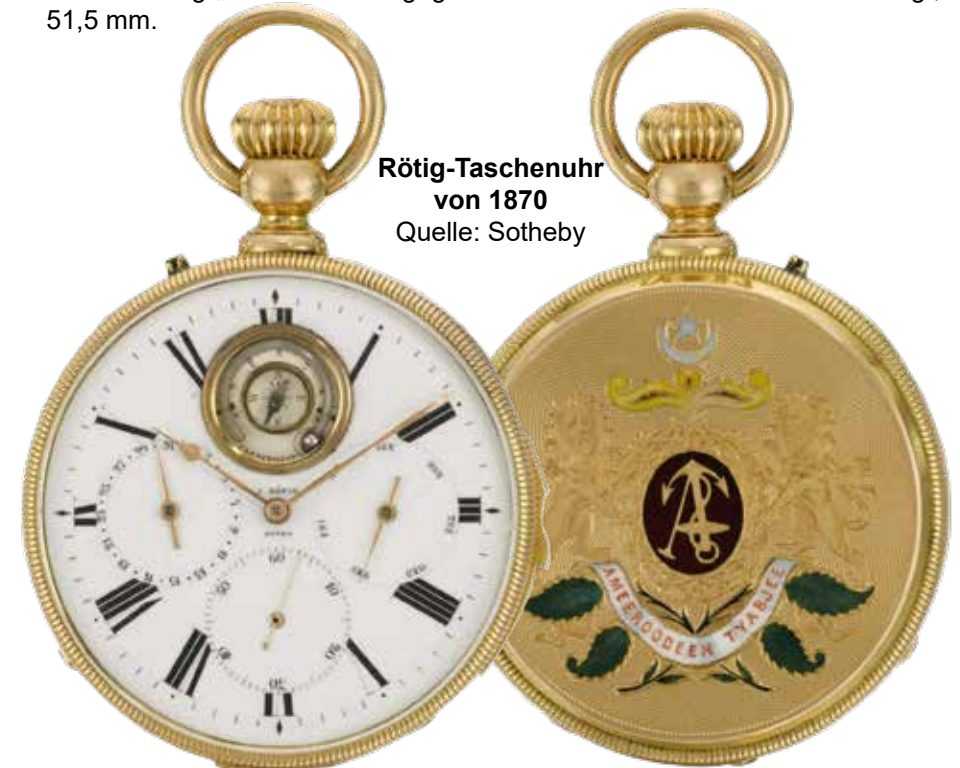
Rötig-Taschenuhr von 1870