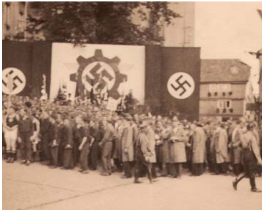
Die Verlegung erster Stolpersteine für Hachenburg durch Gunter Demnig ist für Juli 2012 vorgesehen.