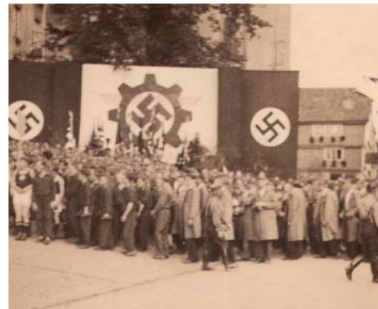
Die Verlegung erster Stolpersteine für Hachenburg durch Gunter Demnig ist für Juli 2012 vorgesehen.

mals in Montabaur lebten und ermordet wurden. Rechnet man die deutschen Opfer der Nazis hinzu, so ergibt sich für die Stadt eine Gesamtzahl von schätzungsweise 30 Getöteten. Die Stolpersteine sollen von privaten Spendern finanziert werden. Der Stückpreis liegt bei 120 Euro. Mehr als 20 Personen haben Widner bereits zugesagt, die Kosten eines Stolpersteins zu übernehmen.