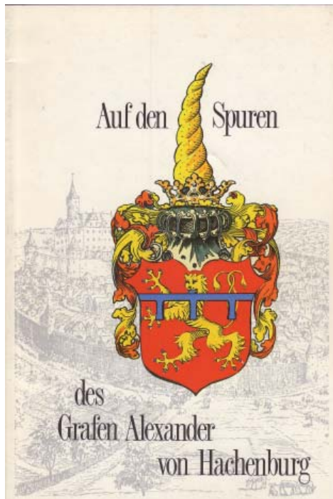
Publikation von Hildegard Sayn, 1993