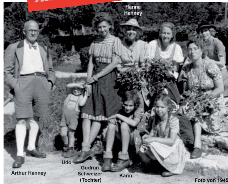
Foto von 1945