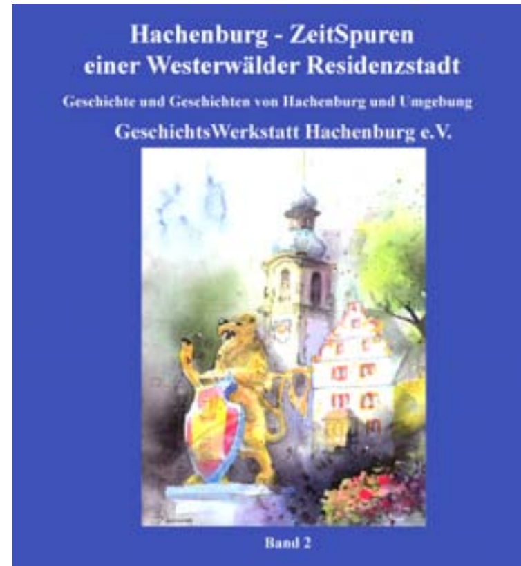
Titelseite des ersten Buches der GeschichtsWerkstatt (Band 2 der Serie „Hachenburg – ZeitSpuren einer Westerwälder Residenzstadt“ mit ergänztem Untertitel „Geschichte und Geschichten von Hachenburg und Umgebung“)

Die Beiträge sollten eine gute Qualität aufweisen. Darüber hinaus benötigen wir geeignetes Bildmaterial für jede Seite (Auflösung 300 dpi - Druckqualität). Bei der Recherche des Materials ist das Redaktionsteam unter Leitung von Bruno Struif gerne behilflich. Quellenangaben und Herkunftsnachweis der Abbildungen sind erforderlich.