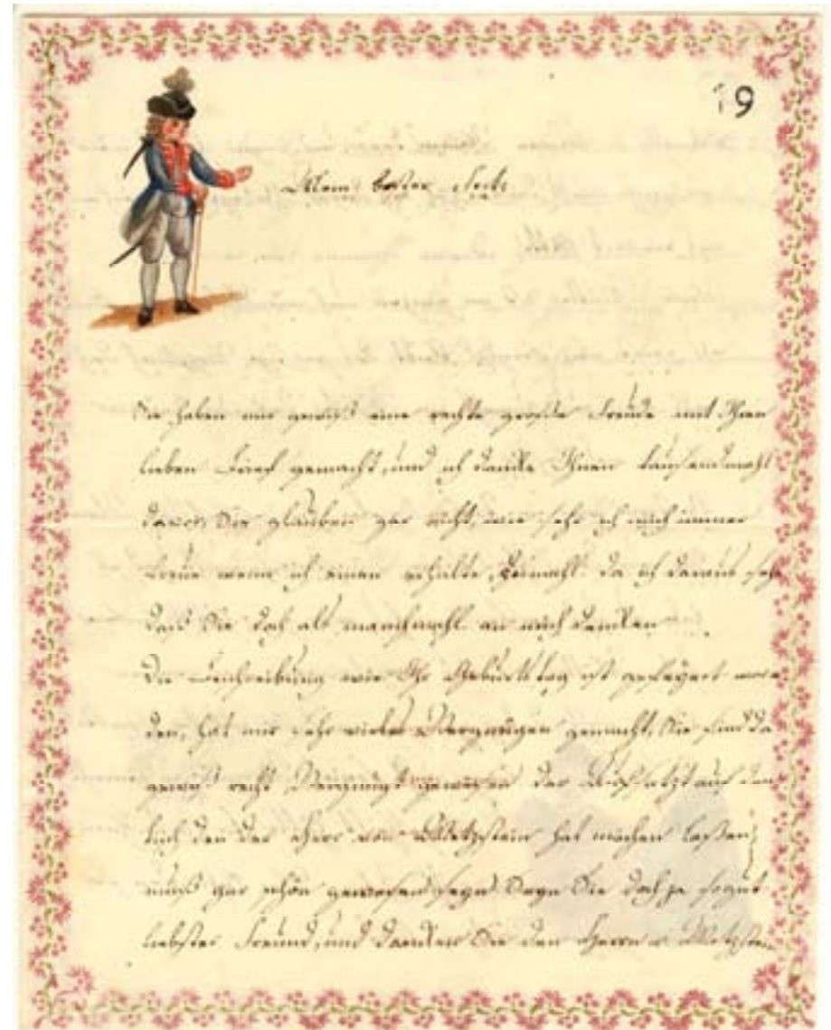
Brief der 12-jährigen Erbgräfin Louise Isabelle von Sayn-Hachenburg an ihren 16-jährigen Bräutigam Erbprinzip Friedrich Wilhelm von Nassau-Weilburg, 7.11.1784

Gekürzter Artikel aus Hessische Familienkunde, Heft 4/2008