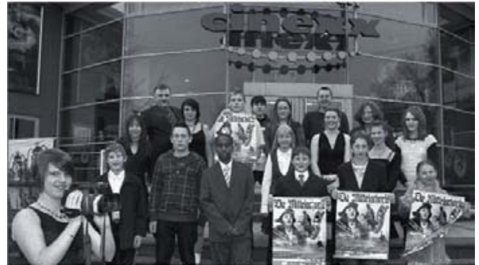
Recherche, Kostüme, Dialoge, Interviews – das Filmprojekt vermittelte den Schülern der Video-AG sowohl Medienkompetenz als auch das Wissen um historische Zusammenhänge. Mit berechtigtem Stolz präsentierten sie jetzt ihr lokalhistorisches Mammutwerk.

Das Video dieses interessanten Films ist auf DVD zu haben, das bei Herrn Sonnenschein unter: thomas.sonnenschein@rz-online.de per E-Mail bestellt werden kann.