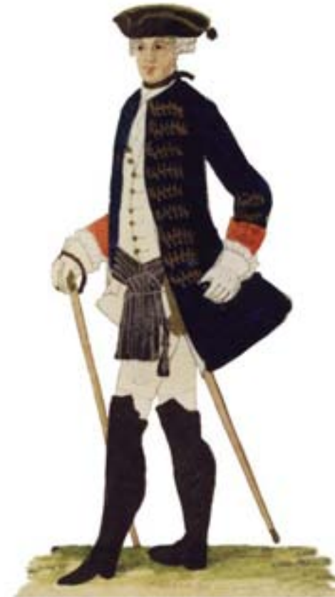
Diese Abbildung zeigt die Uniform eines Offiziers des 44. Preußischen Infanterie-Regiments, in dem der Hachenburger Grafensohn als Bataillonskommandeur diente.